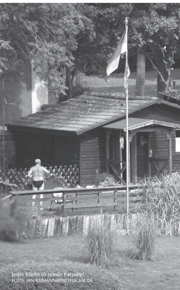
Jeder bleibt in seiner Parzelle!