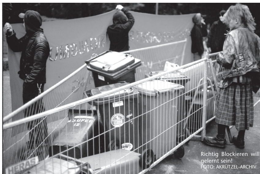
Richtig Blockieren will gelernt sein!

Nützliches Wissen für potentielle Blockierer